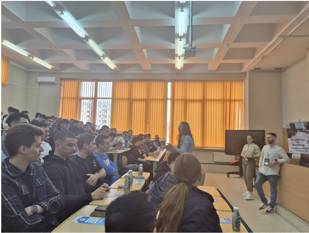
Întâlnirea cu reprezentanții firmei IPSO AGRICULTURĂ, reprezentant John Deere în România (martie 2025)